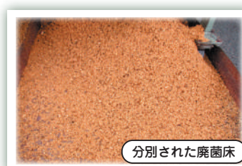
分別された廃菌床