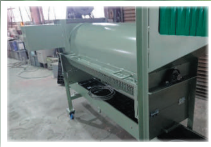
排出口左側 (機内の回転翼逆転仕様)

設置現場のスペースの関係で、投入側からみて左側(写真)に袋を排出することも可能です。ご希望に応じた仕様で製作させていただきます。