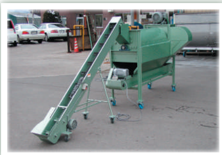
投入口仕様変更 (投入用コンベアと接続)

コンベアの有無に関わらず、構造上可能な範囲で本機の高さも変更可能です。また、粉碎のみご利用の場合は排出口なしの仕様で製作致します。