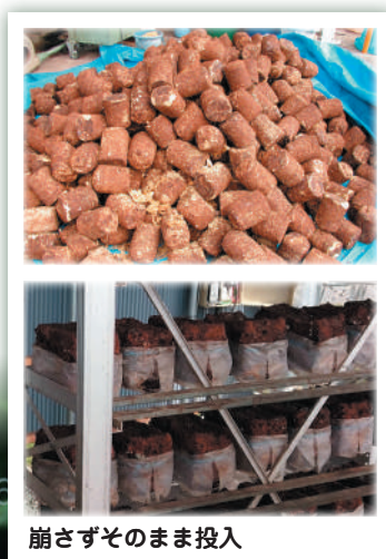
崩さずそのまま投入