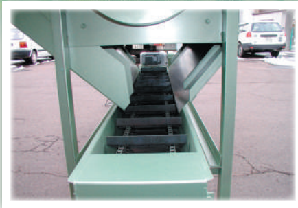
排出コンベアあり

設置現場のスペースの関係で、投入側からみて左側(写真)に袋を排出することも可能です。ご希望に応じた仕様で製作させていただきます。