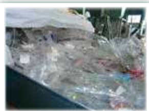
食品系プラ包装材